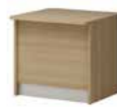
Lada V 040 do 045 80 do 180 x 80 x 75 h