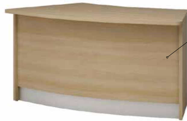
Lada V 046 160 x 90 x 75 h

Front i korpus w dekorze z płyty laminowanej jednobarwnej lub drewnopodobnej