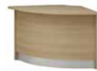
Lada V 047 100 x 100 x 75 h

Front i korpus w dekorze z płyty laminowanej jednobarwnej lub drewnopodobnej