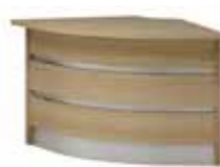
Lada V 047B 100 x 100 x 75 h