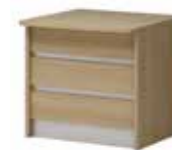
Lada V 040B do 045B 80 do 180 x 80 x 75 h