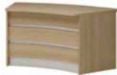
Lada V 048B 160 x 90 x 75 h