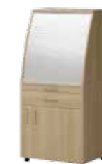
Szafka V 106 74 x 60 x 162 h