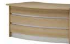
Lada V 046B 160 x 90 x 75 h