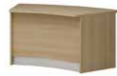
Lada V 048 160 x 90 x 75 h